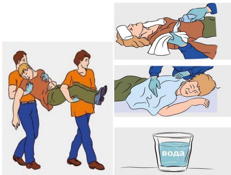
Рисунок 1 – Оказание первой помощи пострадавшему при тепловом ударе

10. Пользуясь рис.1, составьте алгоритм ваших действий по оказанию помощи пострадавшему при тепловом (солнечном) ударе: